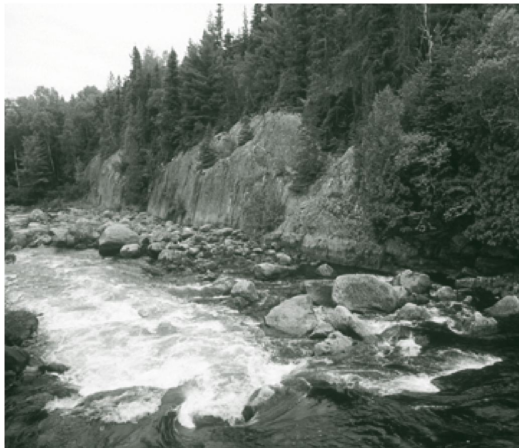
Parc provincial Spanish River

Les projets dans les parcs provinciaux sont assujettis à la Loi sur les évaluations environnementales. Depuis 1978, les entreprises des parcs provinciaux se sont conformées aux obligations émises en vertu de cette loi par le ministre de l'Environnement. Une évaluation environnementale par catégorie fait actuellement l'objet d'un examen.