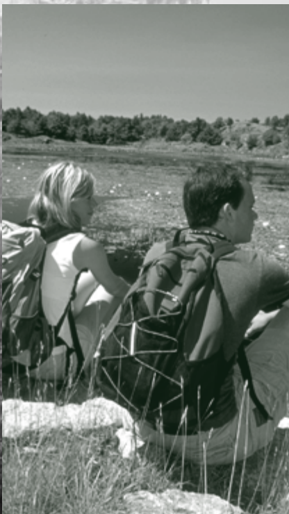
Parc provincial Frontenac

Continuer de traiter les usages non industriels (chasse, engins à moteur, capture d'animaux à fourrure et pêche à l'appât) par réglementation ou politique plutôt que par législation.