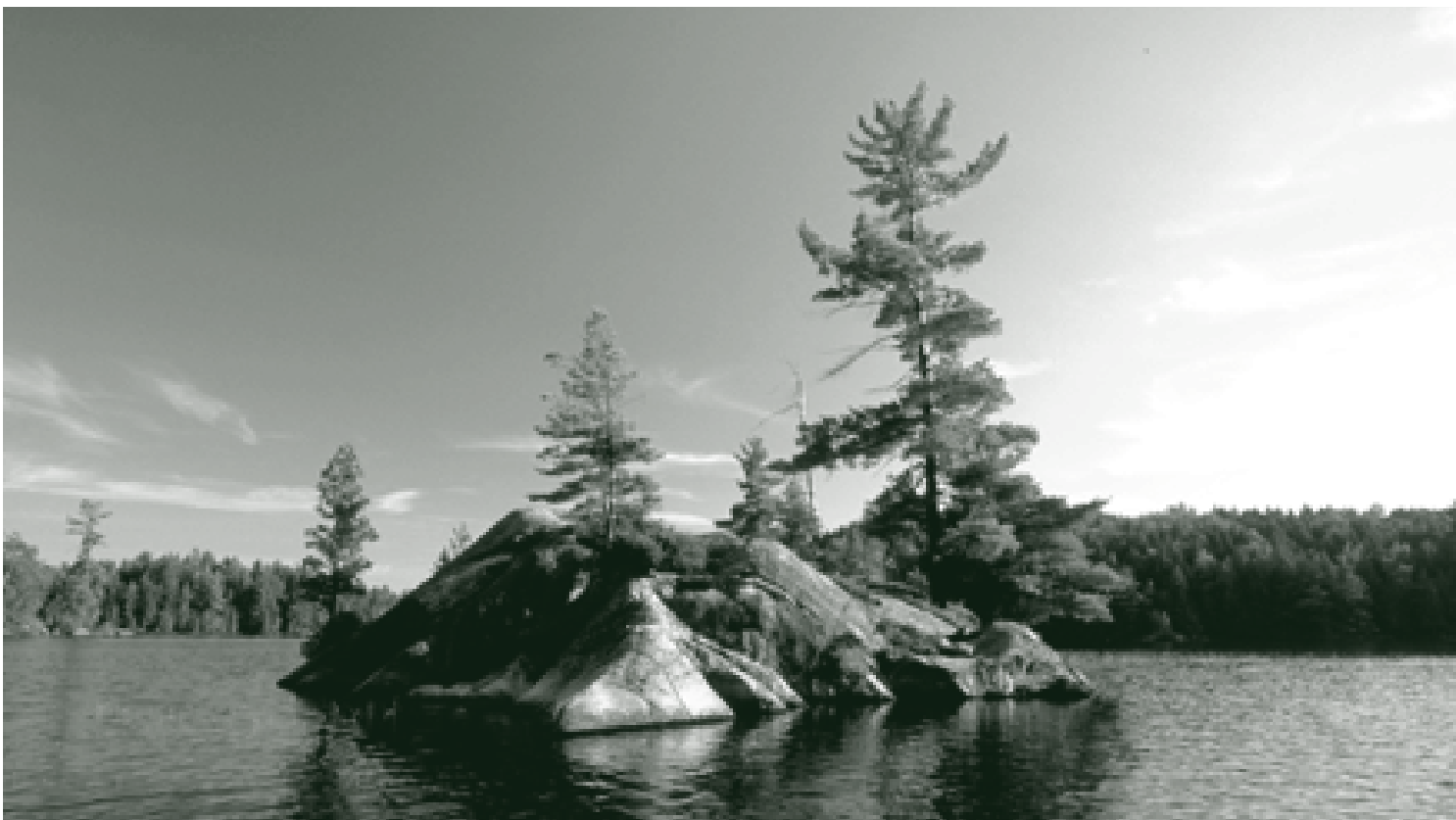
Parc provincial Silent Lake

Étant donné l'intérêt public en ce qui concerne les zones protégées, il est important d'inclure dans la législation des mesures qui amélioreront la transparence et la responsabilité à l'égard du public, telles que les rapports obligatoires sur l'état des zones protégées.